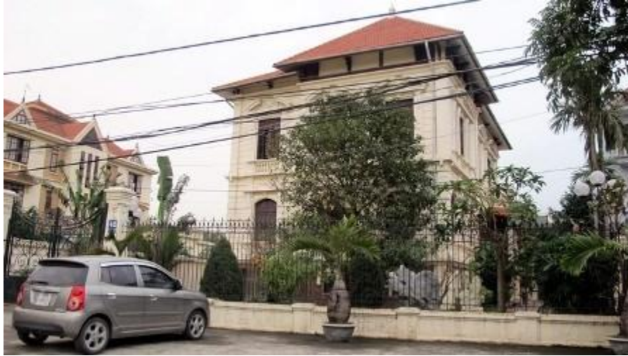
Nhà ở Dương Tự Trọng ở Hải Phòng

Căn hộ tại Skycity nằm trong tổ hợp các căn hộ cao cấp, văn phòng cho thuê, cửa hàng bán lẻ... được bố trí giữa các khuôn viên, tách biệt hẳn với phố xá náo nhiệt bên ngoài; có diện tích từ 100 đến 172 m 2 , được thiết kế view toàn thành phố tuyệt đẹp. Vào thời sốt bất động sản, các căn hộ ở đây từng được rao bán với giá khởi điểm gần 2.000 USD/m 2 tương đương 3-5 tỷ đồng/căn.