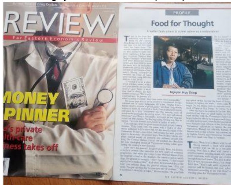
Nhà văn Nguyễn Huy Thiệp trên trang Tạp chí Kinh tế viễn Đông tháng 8 năm 1997