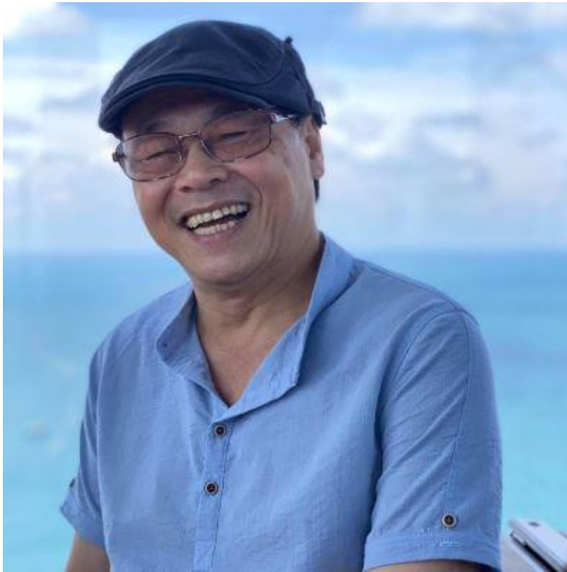
Cựu Phó Tổng biên tập báo Thanh Niên Quốc Phong